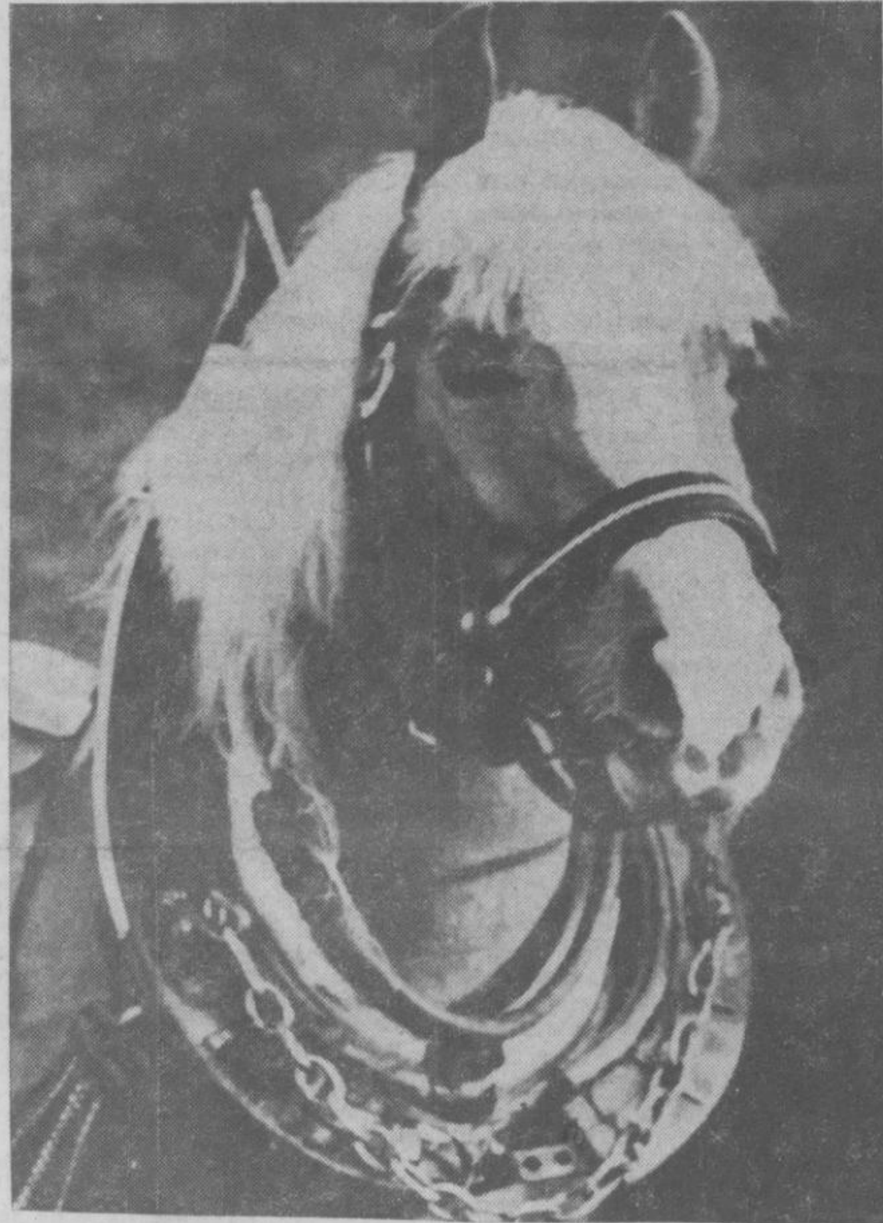
E EN nieuw hoofdstuk voor de paardenfokkerij in Nederland is begonnen door de recente import van Haflingers. Verdere bijzonderheden over de Haflinger vindt U op pag. 162.